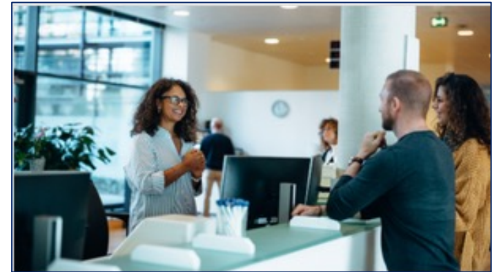
Administrations & Collectivités