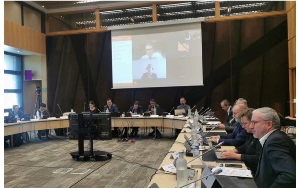
Comité réseaux fixes du 5 octobre 2023